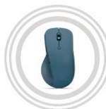
Lenovo Slim Maus