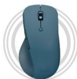
Lenovo Yoga Pro Mouse