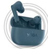
Lenovo Yoga Echte kabellose Stereo-Ohrhörer