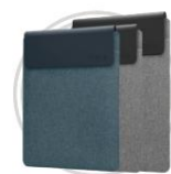
Lenovo Yoga Hülle (14,5" und 16")

* Beispiel für die Namenskonvention im Lenovo-Katalog