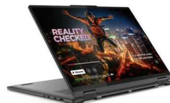
Bild und Ton verschmelzen auf dem großzügigen 16-Zoll-WUXGA-Display und bieten ein immersives Dolby Vision®-Erlebnis sowie ein 10-Punkt-Multitouch-Glaspanel. Dank des höheren 16:10-Bildschirms und einer aktiven Bildschirmfläche von bis zu 91 % erleben Sie Ihr Meisterwerk in voller Pracht. Genießen Sie raumfüllenden Klang, verstärkt durch zwei symmetrische Lautsprecher mit Dolby Atmos®.