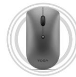
Lenovo Yoga Slim Maus