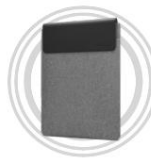
Lenovo Yoga 16- Zoll-Hülle