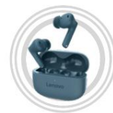
Lenovo TWS Yoga PC-Edition