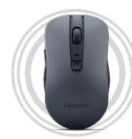
Lenovo WL310 Bluetooth® Lautlose Maus