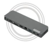
Lenovo USB-C Mini-Dock