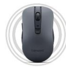
Lenovo WL310 Bluetooth® Lautlose Maus