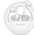
Lenovo E310 Echte kabellose Stereo-Ohrhörer