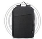
Lenovo 15,6" Laptop- Rucksack B210