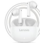
Lenovo E310 Echte kabellose Stereo-Ohrhörer