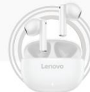
Lenovo E310 Echte kabellose Stereo-Ohrhörer