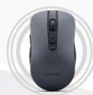
Lenovo WL310 Bluetooth® Lautlose Maus