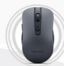
Lenovo WL310 Bluetooth® Lautlose Maus