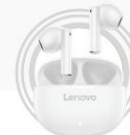
Lenovo E310 Echte kabellose Stereo-Ohrhörer