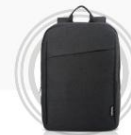
Lenovo 15,6" Laptop- Rucksack B210