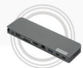
Lenovo USB-C Mini-Dock